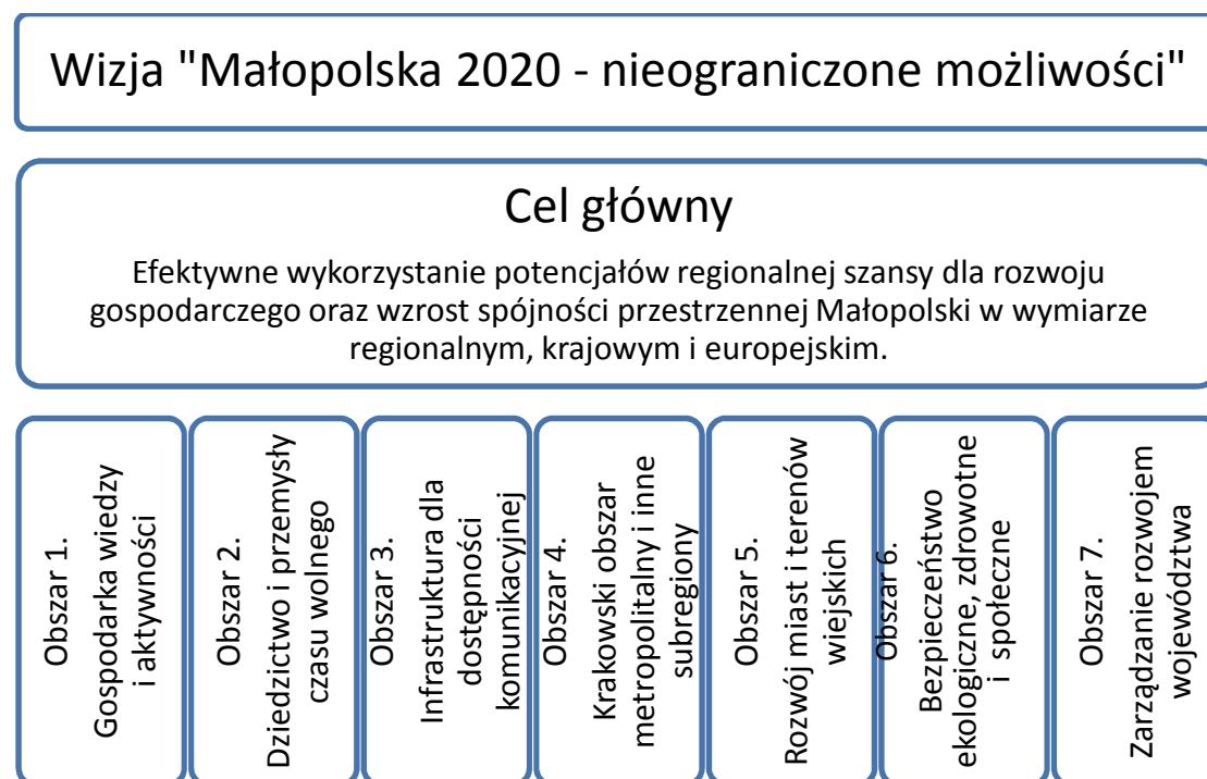
Schemat 2 Struktura Strategii Rozwoju Województwa Małopolskiego na lata 2011-2020.

Rekomendacje dotyczące programowania lokalnej polityki rozwoju można odnaleźć w SRWM w ramach obszaru: Rozwój miast i terenów wiejskich. Wśród kierunków polityki rozwoju