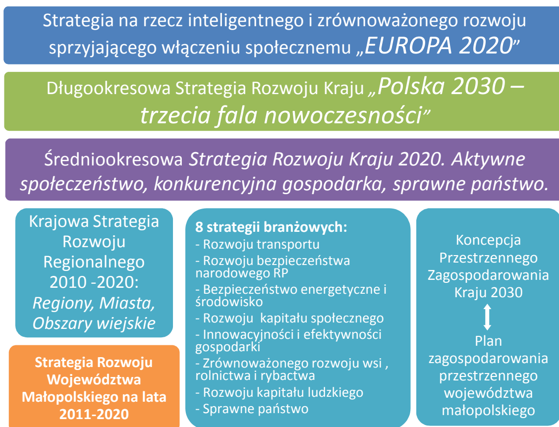
Schemat 1 Układ zależności i hierarchia europejskich, krajowych i regionalnych dokumentów strategicznych.

Ugruntowana praktyka prowadzenia polityki rozwoju na szczeblu gminnym realizowana jest najczęściej w postaci tworzenia gminnych strategii rozwoju. Zasady lokalnej polityki rozwoju powinny jednak uwzględniać wytyczne w zakresie prowadzenia polityki rozwoju na wyższych szczeblach. Poczynając od dokumentów na szczeblu Unii Europejskiej, w szczególności uwzględniając zasady Europejskiej Polityki Spójności, poprzez strategiczne dokumenty krajowe, przygotowywane przede wszystkim przez administrację rządową, a kończąc na wojewódzkiej i subregionalnej strategii rozwoju, opracowywanych przez samorząd województwa.